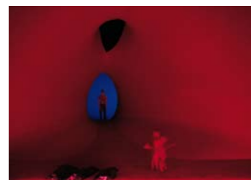
Idomeneo, Glyndebourne 2003