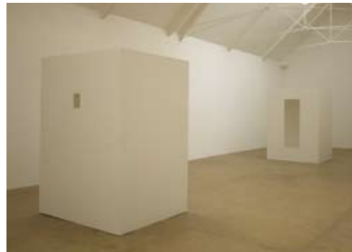
Lisson Gallery, London 1995