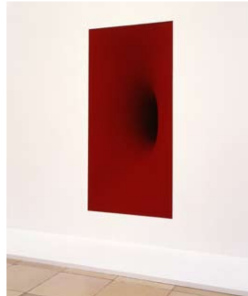
Hirshhorn Museum, Washington DC 1999