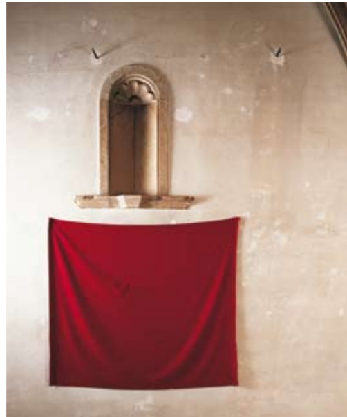
Kunst-Station St. Peter, Köln / Cologne 1996