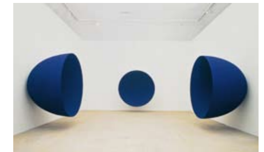
Kunstverein Hannover 1991