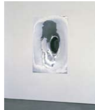
De Pont Foundation, Tilburg 1995