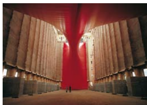
BALTIC, Gateshead 1999