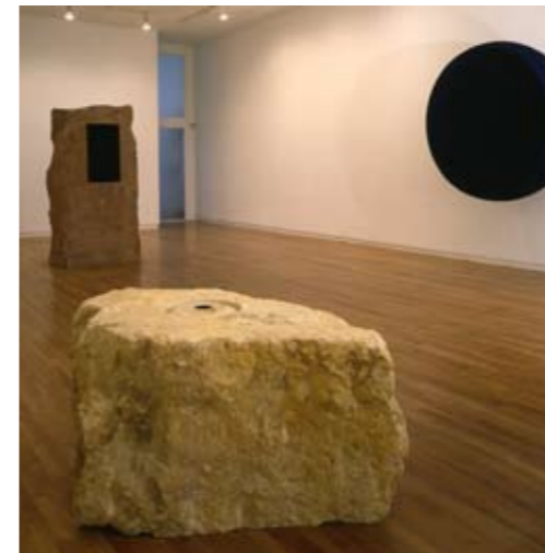
Barbara Gladstone Gallery, New York 1989