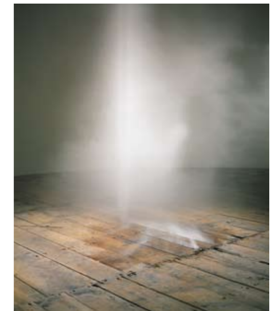
Galleria Continua, San Gimignano 2003