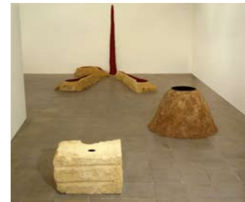
Lisson Gallery, London 1988