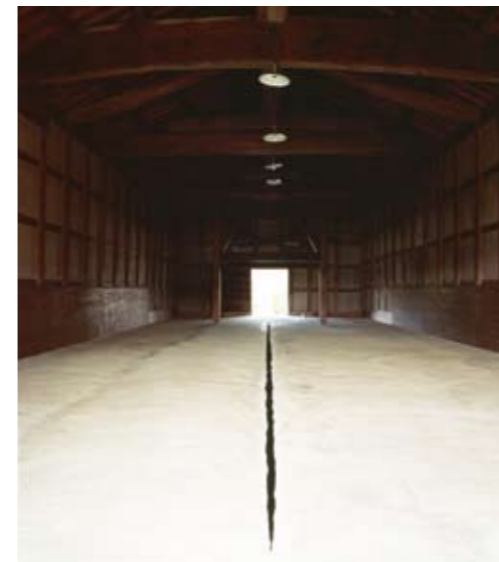
6th Japan Ushimado International Art Festival 1991