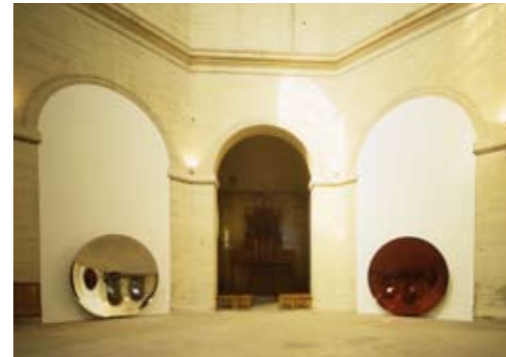
Chapelle de la Salpêtrière, Paris 1998