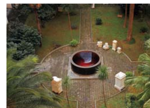
Museo Archeologico Nazionale, Neapel / Naples 2003