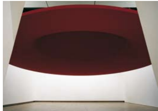
Hayward Gallery, London 1998