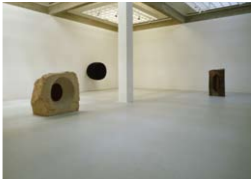
Tel Aviv Museum of Art 1993