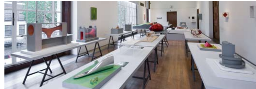
RIBA, London 2008