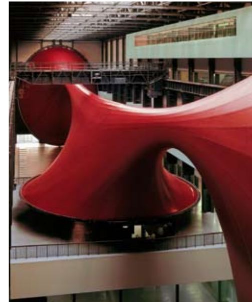
Tate Modern, London 2002