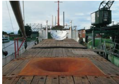
Stade, Deutschland / Germany 1997