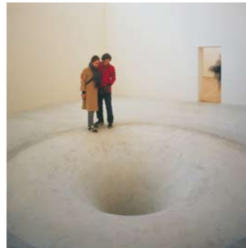
Malmö Konsthall 1996