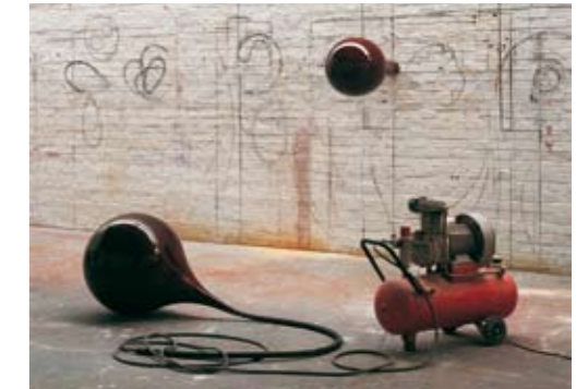
fig-1, London 2000