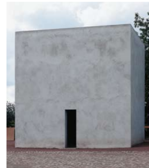
documenta IX, Kassel 1992