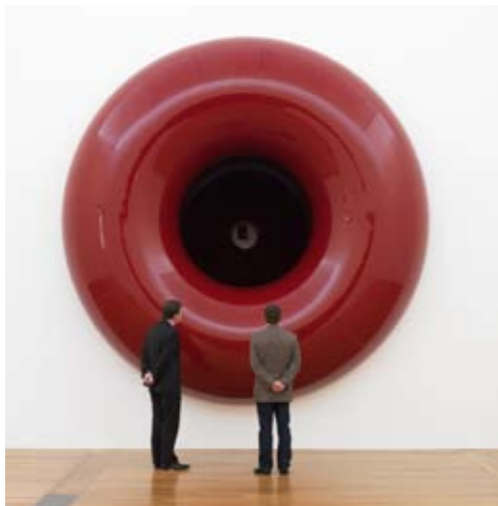
Queensland Art Gallery, Brisbane 2007