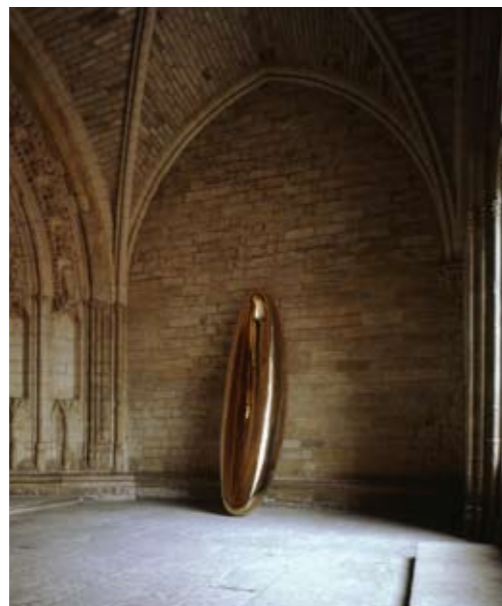
Palais des Papes, Avignon 2000