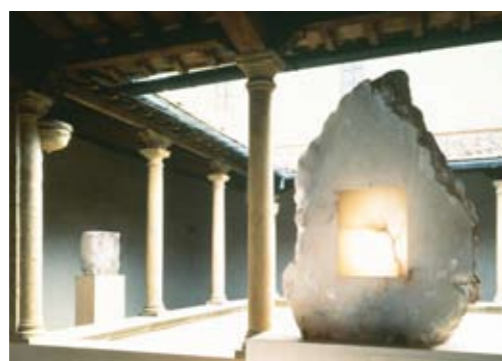
Arte all'Arte, San Gimignano 1997