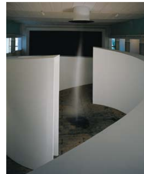
Galleria Continua, San Gimignano 2003