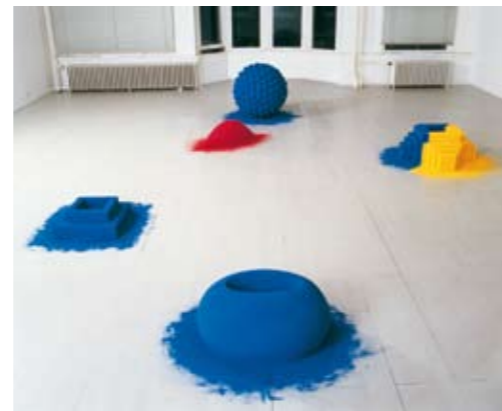
Galerie 't Venster, Rotterdam 1983