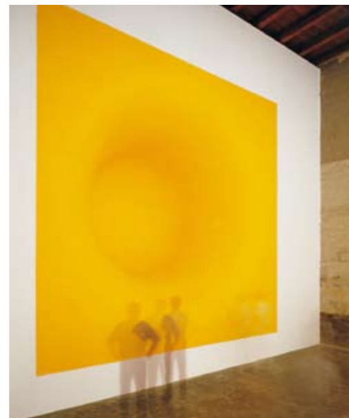
Palais des Papes, Avignon 2000