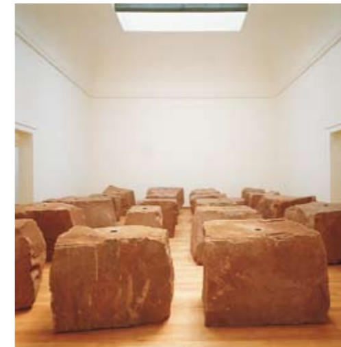
XLIV Biennale di Venezia 1990

Geboren in Bombay (heute Mumbai), Indien, 1954, lebt und arbeitet in London