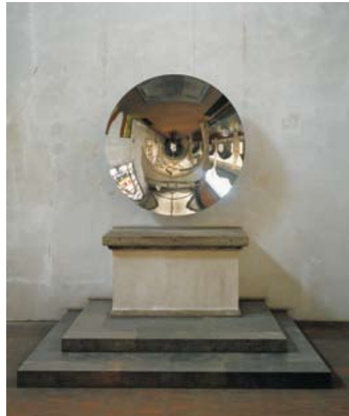
Kunst-Station St. Peter, Köln / Cologne 1996