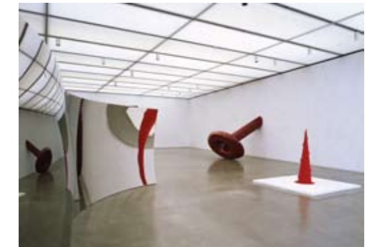
ICA, Boston 2008