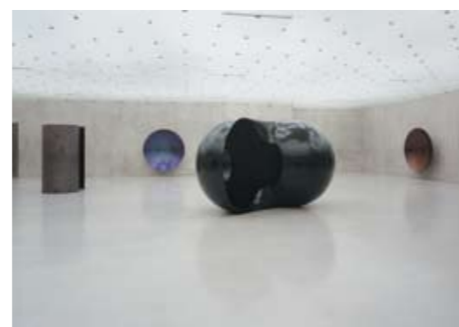
Kunsthhaus Bregenz 2003