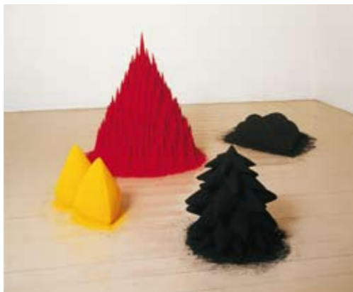
Lisson Gallery, London 1982