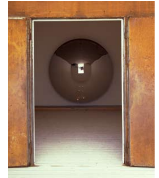
Kunsthalle Erfurt 2003