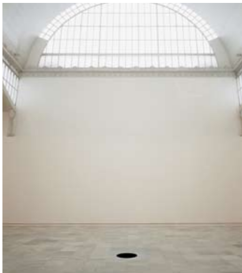
Palacio de Velázquez, Madrid 1991