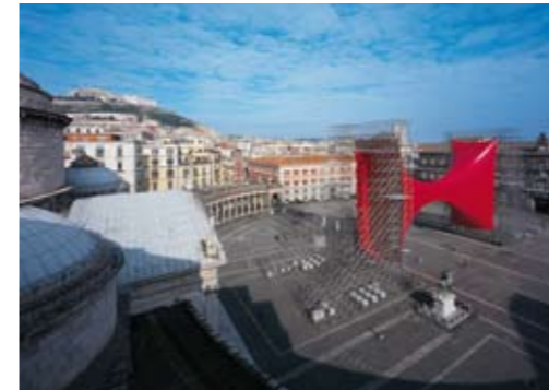
Piazza del Plebiscito, Neapel / Naples 2000