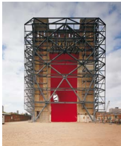
BALTIC, Gateshead 1999