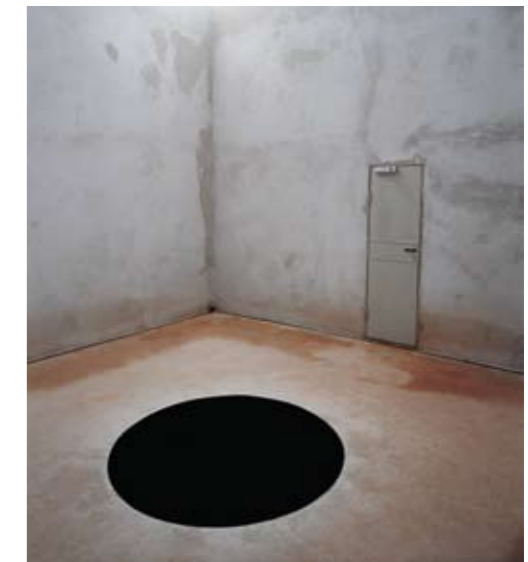
documenta IX, Kassel 1992