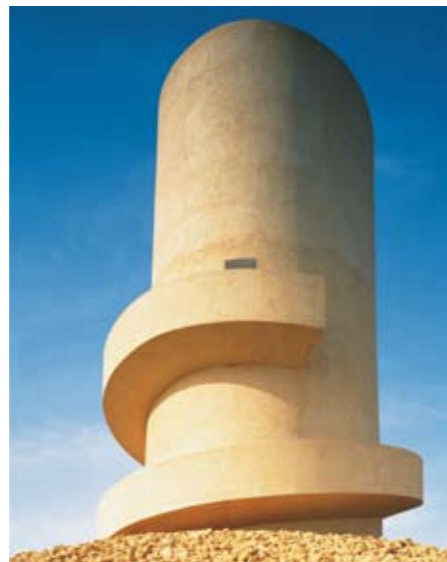
Expo '92, Sevilla 1992