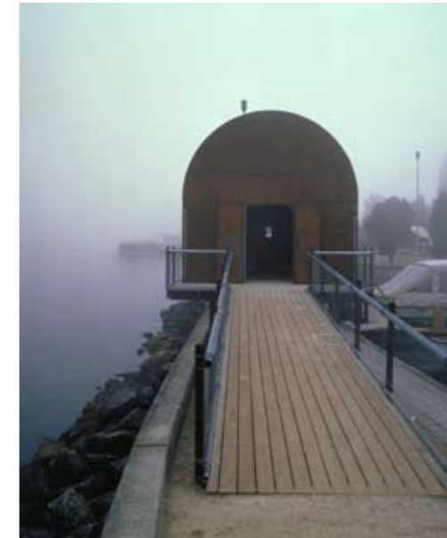
Kunsthalle Erfurt 2003