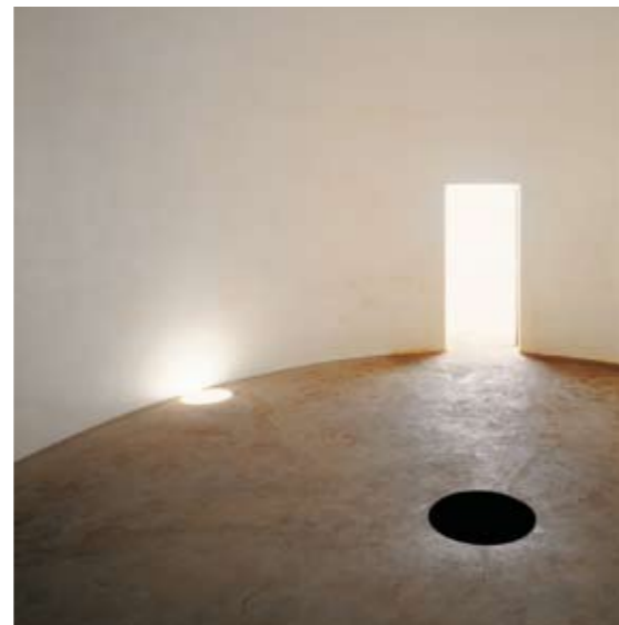
Expo '92, Sevilla 1992