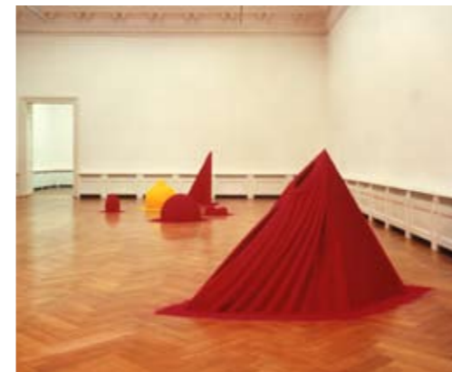
Kunsthalle Basel 1985