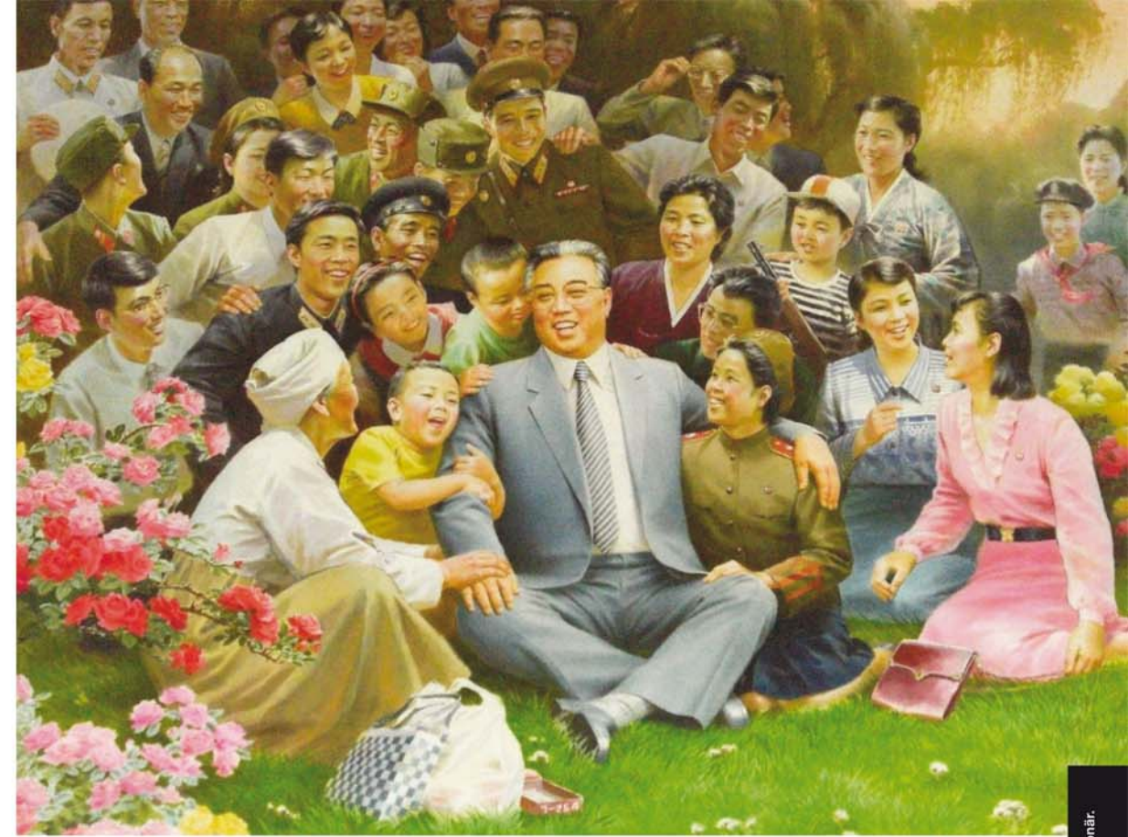
BLUMEN FÜR KIM IL-SUNG Zum Gesamtkunstwerk Nordkorea

Mit Mitteln des EU-Culture Programme 2007–2013 spürt das Projekt „JOSEF HOFFMANN: Inspirations“ in Brtnice die künstlerischen Einflüsse auf, die auf Hoffmann als einen der wichtigsten Architekten und Entwerfer des 20. Jahrhunderts gewirkt hatten.