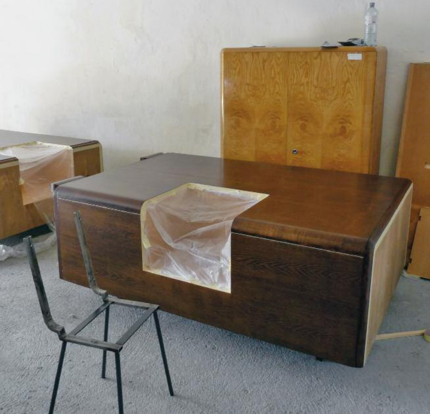
Erwin Wurm, Möbel 5 (l.) / Möbel 4 (r.), 2010 Holz, Stoff, Metall wood, fabric, metal, 75 x 120 x 183 cm / 75 x 183 x 120 cm

Wie kaum ein anderer versteht es Erwin Wurm, die Muster unserer status- und konsumorientierten Gesellschaft zu entlarven. Er ist bereits seit langem dem MAK verbunden, so erweitern etwa seine Skulpturen „Fat Car“ und „Geste Mobil“ den künstlerischen Fuhrpark der MAK-Sammlung Gegenwartskunst. Im Mittelpunkt der Ausstellung „ERWIN WURM. Schöner Wohnen“, die 2011 im Rahmen der Reihe „KÜNSTLER IM FOKUS“ präsentiert wird, stehen Objekte mit Gebrauchswert: Das Möbel als Instrument des Kollektivs ist ein Gegenstand, an dem sich modellhaft Lebenshaltungen manifestieren.